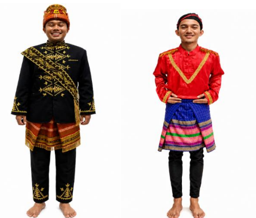
Gambar 3. dan 4. Busana Syekh Dan Pemain Rapa'i Geleng

Busana pemain didominasi warna merah, emas, dan biru menunjukkan kuatnya keterkaitan antara pertunjukan rapa'i geleng dengan identitas budaya Aceh. Warna merah dapat dimaknai sebagai simbol semangat dan keteguhan, sedangkan ornamen emas merepresentasikan kehormatan dan kemuliaan yang menjadi bagian dari nilai budaya masyarakat Aceh. Penggunaan ija kroeng (kain sarung) berwarna biru semakin menegaskan karakter lokal yang melekat pada pertunjukan ini. Dalam perspektif dakwah kultural, busana tidak hanya berperan sebagai elemen visual yang memperindah pertunjukan, tetapi juga sebagai media simbolik yang mengomunikasikan nilai-nilai budaya dan keislaman kepada masyarakat.