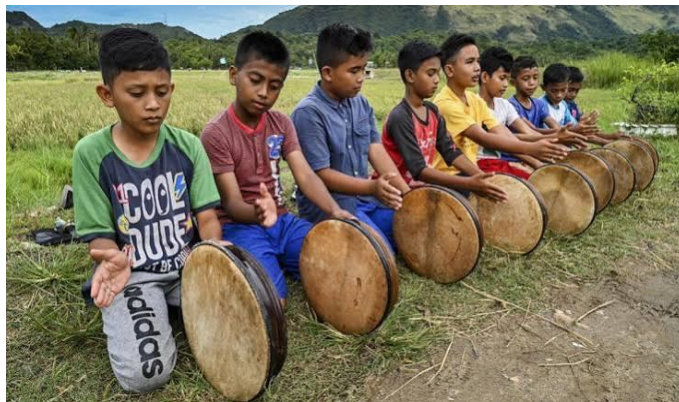
Gambar 5. Proses Latihan Rapa'i Geleng

Selain kebersamaan, praktik pertunjukan juga memperlihatkan nilai disiplin dan tanggung jawab. Pemain harus mematuhi aturan pertunjukan, mengikuti perubahan tempo, menjaga keseragaman gerak, serta merespons instruksi syekh secara tepat. Kepatuhan terhadap struktur pertunjukan tersebut menunjukkan proses internalisasi nilai disiplin dan tanggung jawab yang tidak hanya dipelajari secara konseptual, tetapi juga dipraktikkan secara langsung dalam aktivitas berkesenian. Hal ini menjelaskan bahwa praktik budaya tradisional berperan sebagai sarana pembentukan karakter melalui internalisasi nilai disiplin, tanggung jawab, dan komitmen sosial (Taneo & Madu, 2023).