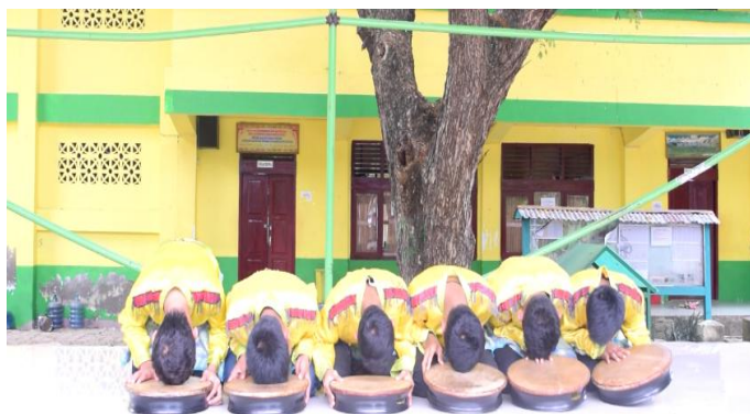
Gambar 1. Keserempakan Gerakan Pemain Rapa'i Geleng Babak Saleum (Sumber: Dokumentasi Yuli Astuti, 2017)

Struktur kepemimpinan dalam rapa'i geleng juga mengandung makna simbolik yang berkaitan dengan ajaran Islam. Syekh berperan sebagai pemimpin yang mengatur jalannya syair, irama, dan gerakan pemain, sedangkan seluruh pemain mengikuti arahan syekh secara terkoordinasi sehingga pertunjukan berlangsung secara harmonis. Pola hubungan tersebut melambangkan konsep kepemimpinan dalam Islam yang menekankan pentingnya amanah, keteladanan, dan ketaatan terhadap pemimpin yang menjalankan tugasnya dengan baik. Dalam kajian seni pertunjukan, unsur visual dan simbolik berfungsi sebagai media representasi nilai-nilai budaya yang memungkinkan pesan sosial dan moral disampaikan secara tidak langsung kepada masyarakat (Ramli & Saputra, 2023).