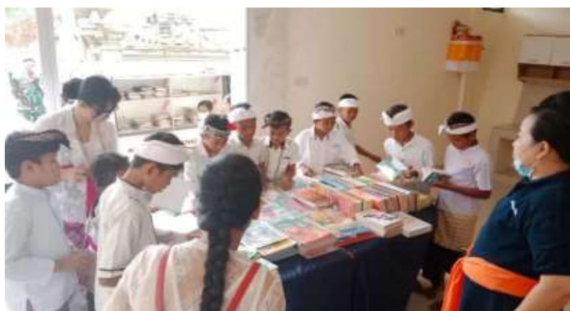
Gambar 2. Keaktifan Peserta Didik Saat di Perpustakaan

Selain dampak positif pada prestasi akademik, penelitian ini juga mengungkapkan bahwa pendidikan karakter yang diintegrasikan dalam Kurikulum Merdeka memiliki pengaruh yang signifikan pada pengembangan pribadi dan sosial siswa. Temuan yang mengindikasikan bahwa siswa yang terlibat dalam aktivitas pendidikan karakter memiliki tingkat empati yang lebih tinggi adalah sangat penting. Ini menunjukkan bahwa pendidikan karakter membantu siswa memahami dan merasakan perasaan orang lain, yang merupakan keterampilan sosial yang sangat berharga. Selain itu, kemampuan siswa untuk berinteraksi lebih baik dengan teman sebaya dan orang dewasa juga menunjukkan dampak positif pendidikan karakter dalam Kurikulum Merdeka pada perkembangan kemampuan sosial siswa. Penelitian ini menegaskan pentingnya pendidikan karakter yang terintegrasi dalam Kurikulum Merdeka dalam membentuk siswa yang tidak hanya sukses secara