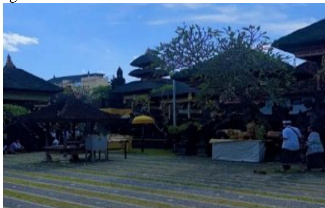
Gambar 1. Bentuk bangunan Pura Agung Pasek Sumertha

Eksistensi objek material kain ulap-ulap yang bertuliskan ragam jenis aksara modre secara dominan terdistribusi pada komponen struktural pelinggih di area Utama Mandala (jeroan), seperti yang terpasang rigid pada Padmasana , Gedong Pelinggih , Meru , serta Pelinggih Ratu Pasek . Tata letak spasial arsitektur tradisional serta zonasi pembagian ruang pura yang mengadopsi konsep teo-ekologis Tri Mandala secara visual dapat diamati pada gambar 1.