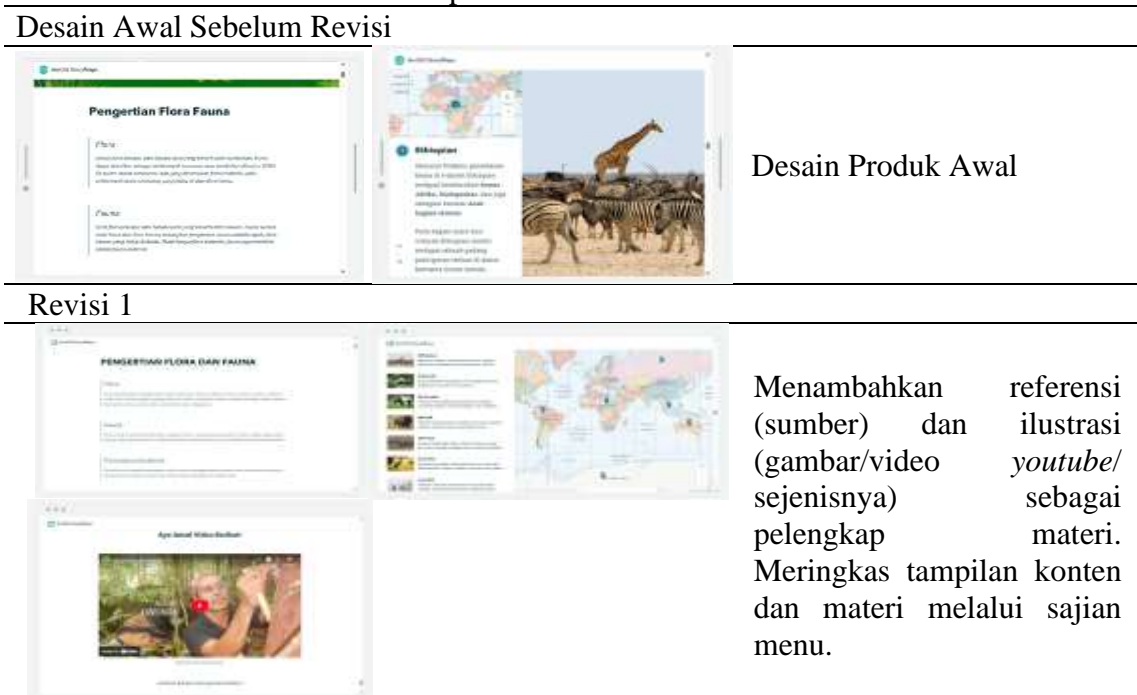
Tabel 4. Perbedaan Tampilan Media Sebelum dan Setelah Perbaikan

Pada tahap pengembangan dan validasi, peneliti menemukan adanya kekurangan dalam produk yang dikembangkan. Kekurangan yang ditemukan dalam produk pengembangan media pembelajaran terkait dengan kurangnya sumber yang dijadikan rujukan dalam mengisi materi dalam media, tampilan media yang kurang rapi dan menarik serta user experience yang dirasa masih perlu diperbaiki. Berdasarkan kekurangan tersebut, peneliti memperoleh saran dan masukan dari validator untuk memperbaiki serta menyempurnakan produk. Melalui saran dan masukan yang diberikan oleh validator, dapat diperoleh hasil pengembangan produk media pembelajaran yang maksimal dan layak untuk diterapkan. Berikut merupakan hasil revisi yang telah dilakukan dengan merujuk pada arahan, saran dan masukan dari para ahli selaku validator pada tahap pengembangan dalam penelitian ini.