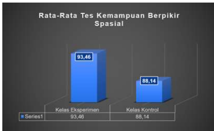
Gambar 2. Nilai Rata-Rata Kelas Eksperimen dan Kontrol

Berdasarkan rekapitulasi hasil yang terdapat pada tabel 6, teridentifikasi perolehan nilai rata-rata post-test kemampuan berpikir spasial antara kedua kelas memiliki perbedaan sebesar 6,03%. Hasil tersebut ditunjukkan dengan nilai rata-rata post-test kelas eksperimen (93,46) yang lebih unggul 5,32 dibandingkan dengan nilai rata-rata post-test kelas kontrol (88,14).