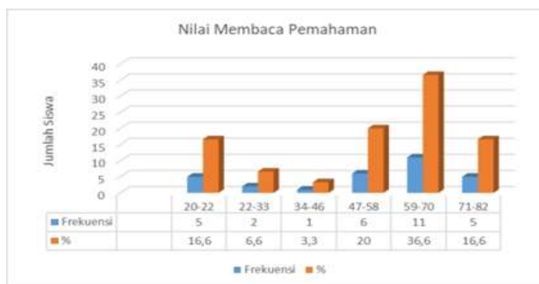
Gambar 1. Grafik Nilai Membaca Pemahaman Siswa Kelas V Pada Kondisi Awal Sebelum Tindakan

a) Pengolahan Data, Data yang diperoleh dari hasil observasi, pencatatan, dan LKPD diolah untuk memperoleh informasi yang relevan. Peneliti menghitung frekuensi dan persentase masing-masing kategori penilaian untuk menilai pemahaman membaca siswa. b) Analisis Kualitatif, Peneliti menganalisis data kualitatif dari lembar observasi untuk menilai kesesuaian pelaksanaan pembelajaran dengan Modul ajar atau Rencana Pelaksanaan Pembelajaran (RPP). Aspek-aspek yang dinilai meliputi tujuan pembelajaran, metode yang digunakan, dan interaksi antara guru dan siswa. c) Analisis