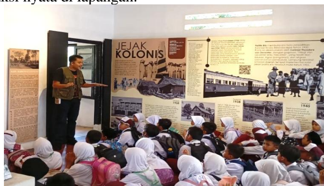
Gambar 2. Strategi Hibrida melalui Aktivasi Ruang Cagar Budaya di lapangan

Tangkapan layar ( screenshot ) menunjukkan bagaimana akun komunitas lokal seperti @metrowalkingtour melakukan dekonstruksi narasi formal menjadi konten visual yang populer. Interaksi publik dalam bentuk likes (menyukai) dan komentar merepresentasikan terbentuknya memori konektif Adriaansen & Smit (2025) sebelum beralih menjadi aksi nyata di lapangan.