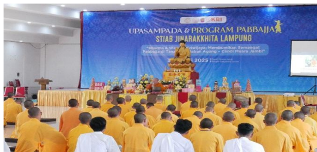
Gambar 1. Pelatihan Pabbaja dalam Pembinaan Rohaniwan

Temuan ini menegaskan bahwa Buddhayana menciptakan kerangka spiritual yang adaptif dan relevan untuk kebutuhan masyarakat Buddhis modern di Indonesia. Selain itu, adanya kerangka konseptual yang dibentuk melalui proses pembelajaran salah satunya adalah dengan pelatihan pabbaja . Pelatihan Pabbaja dilakukan sebagai penguat untuk membentuk pandangan-pandangan non-sektarian kepada para biksu maupun biksuni (Williams, 2005).