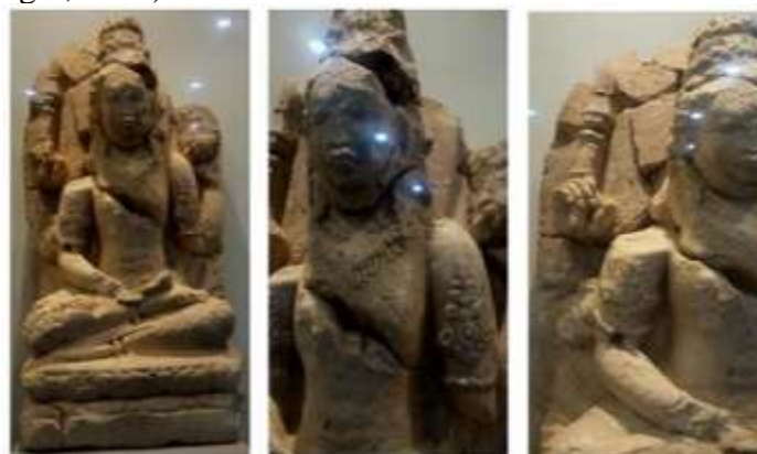
Gambar 4. Arca Siwa Bumi Ayu

Temuan arca yang mendukung kuat bahwa candi-candi di atas adalah candi Hindu, yaitu temuan arca Ganesha dan arca Wisnu dari Kota Kapur. Arca Siwa Mahadewa, arca Wisnu diatas Garuda, arca Siwa di atas Wahana, arca Brahma dari Candi 1 dan 3 di situs Bumiayu. Selain itu ditemukan juga yoni di Candi Angsoka dan Candi Lesung Batu (Siregar, 2016).