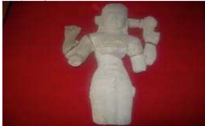
Gambar 3. Arca Wisnu dari Kota Kapur (Sumber: Hudaidah & Elsabela, 2022)

Candi Hindu lainnya yaitu candi Bumiayu merupakan kompleks percandian. Candi 1 dan candi 3 di kompleks candi Bumiayu adalah tempat pemujaan umat Hindu Siwa pada masa Sriwijaya. Namun juga sebagai tempat upacara dan prosesi keagamaan Hindu untuk menyembah dewa, arwah leluhur, serta tempat pemakaman leluhur (Hudaidah & Elsabela, 2022).