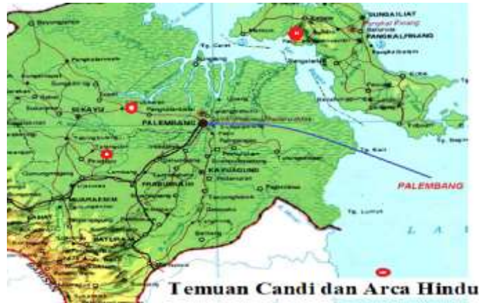
Gambar 2. Peta Situasi Hindu di Budha di Pedalaman

Candi Hindu lainnya yaitu candi Bumiayu merupakan kompleks percandian. Candi 1 dan candi 3 di kompleks candi Bumiayu adalah tempat pemujaan umat Hindu Siwa pada masa Sriwijaya. Namun juga sebagai tempat upacara dan prosesi keagamaan Hindu untuk menyembah dewa, arwah leluhur, serta tempat pemakaman leluhur (Hudaidah & Elsabela, 2022).